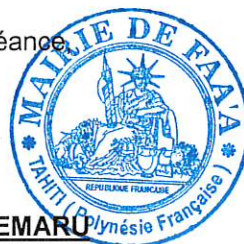
Oscar Manutahi TEMARU

Le Maire de la Commune de Faa'a atteste, sous sa responsabilité, que le présent acte a été transmis au Haut commissaire de la République en Polynésie française le 09.MAI.2017 et affiché le 09.MAI.2017