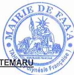
Oscar Manutahi TEMARU

Le Maire de la Commune de Faa'a atteste, sous sa responsabilité, que le présent acte a été transmis au Haut commissaire de la République en Polynésie française le 29.FEV.2016 et affiché le 29.FEV.2016